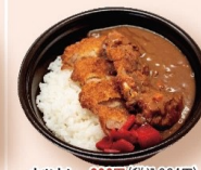
カツカレー800円 〈税込864円〉 ミニカツカレー528円 〈税込570円〉 カレーライス728円 〈税込786円〉 ミニカレーライス428円 〈税込462円〉