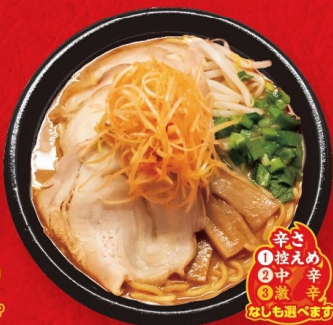
みそネギチャーシュー ラーメン(赤みそ・白みそ)