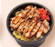
鶏めし丼 728円 〈税込786円〉 ミニ428円 〈税込462円〉