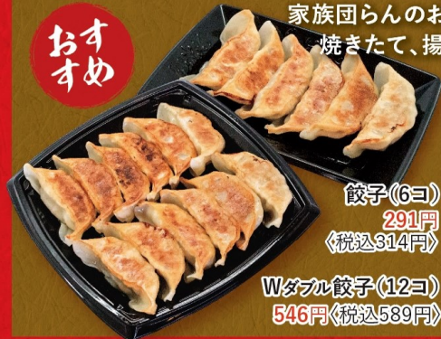
餃子(6個) 291円 〈税込314円〉