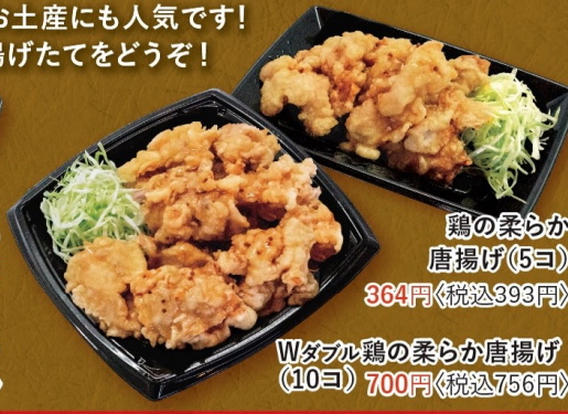
鶏の柔らか 唐揚げ(5個) 364円 〈税込393円〉