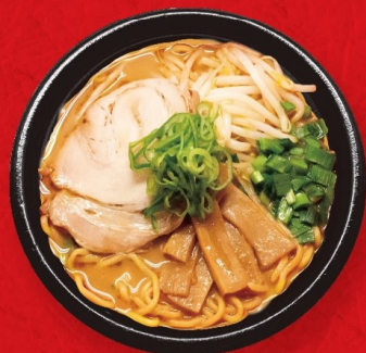
みそラーメン (赤みそ・白みそ)