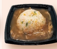
フカヒレあんかけチャーハン 800円 〈税込864円〉 半チャーハン428円 〈税込462円〉