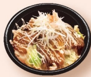
炙りチャーマヨ丼 728円 〈税込786円〉 ミニ428円 〈税込462円〉

御飯物 お米は宮城県産を使用。2種類のサイズからお選び頂けます。 ライス 246円 〈税込266円〉 半ライス 137円 〈税込148円〉