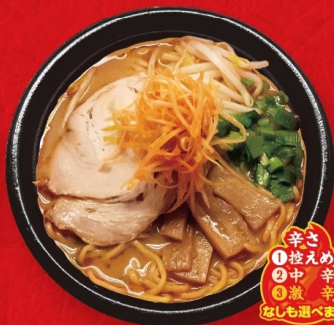
みそネギラーメン (赤みそ・白みそ)