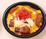
カツ丼 728円 〈税込786円〉 ミニ428円 〈税込462円〉